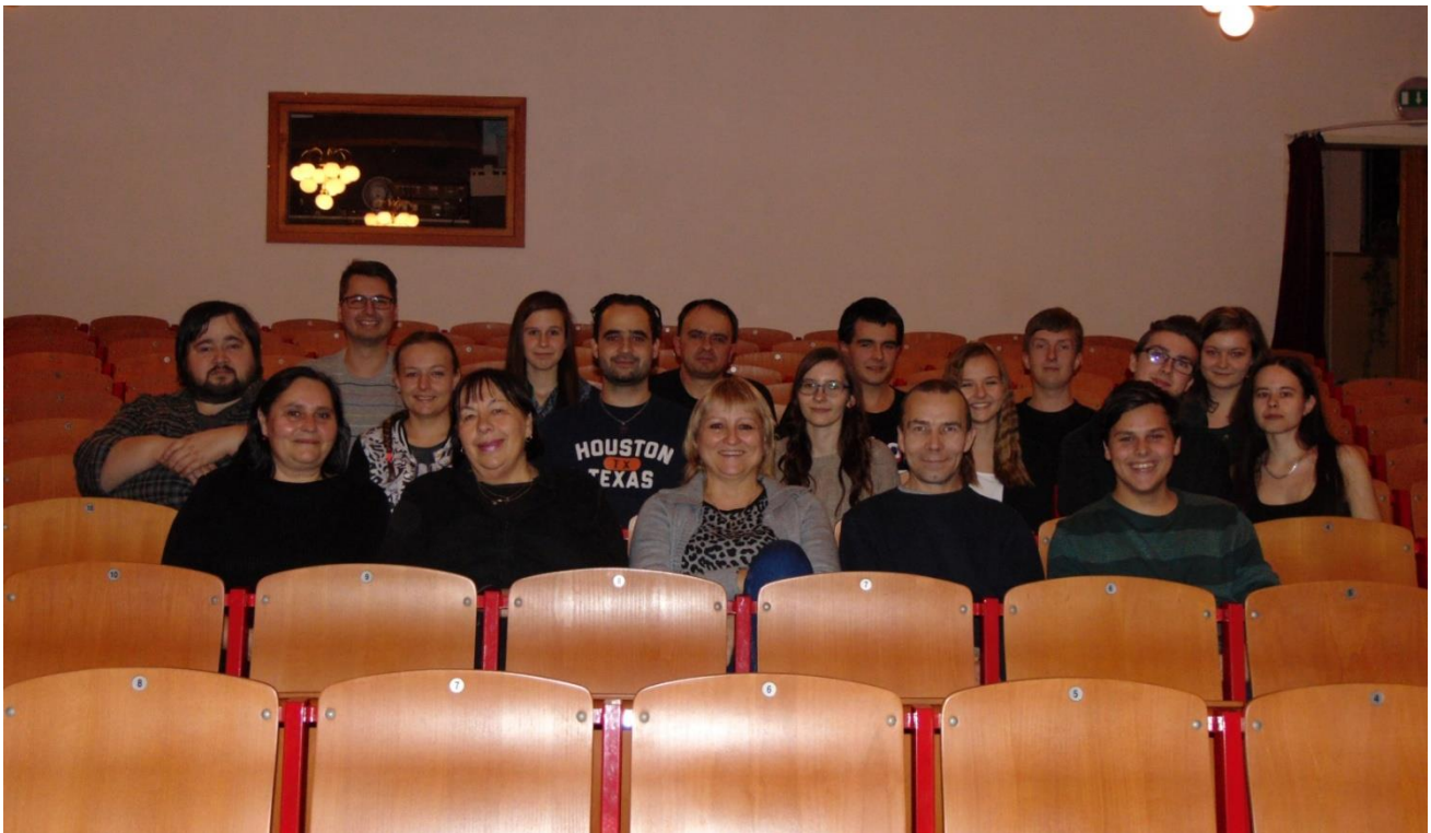
Členové souboru Loutkového divadla Sokol Přerov – Přerovský Kašpárek.

V roce 2008 byla největším úspěchem cena pro náš loutkový soubor za první místo na LOUČKÁŘSKÉ CHRUDIMI v kategorii individuálních výstupů.